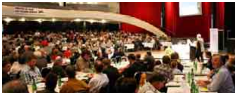
Les délégués adoptent une résolution contre un accord de libre-échange agricole avec l'UE.

La journée s'est conclue par un exposé du professeur Harald von Witzke de l'Université Humboldt de Berlin, qui a participé à l'assemblée comme orateur invité. Son intervention s'est concentrée sur la situation des matières premières agricoles à l'échelle mondiale, avec des estimations quant à l'évolution de leur prix. Harald von Witzke a prédit la fin de la tourmente et des baisses incessantes des prix des matières premières dans l'agriculture: «L'agriculture va redevenir un secteur prospère.»