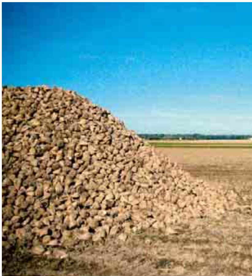
L'USP a dirigé le secrétariat des betteraviers et accompagné les dures négociations concernant la prise en charge des betteraves.

Les producteurs ont reçu les nouvelles directives avec les nouvelles vignettes à la fin de l'année. Des travaux ont en outre démarré afin de pouvoir continuer de positionner AQ Viande Suisse comme plateforme de service intégrale pour la délivrance d'attestations d'assurance qualité au sein de la filière viande.