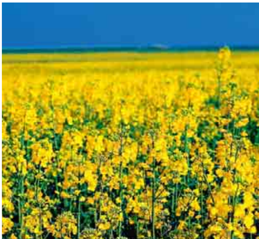
Malgré une augmentation de 4% en 2008 des surfaces de culture de colza, l'offre indigène ne parvient pas à couvrir la demande croissante.

La production animale connaît également une bonne année, malgré la hausse du coût des fourrages. Le bétail de rente et le bétail de boucherie sont très prisés. La hausse du nombre d'animaux requis dans la production laitière y est sans doute aussi pour quelque chose. L'offre disponible sur le marché porcin affiche un net repli. Si cette situation permet d'obtenir de bons prix, elle dé-