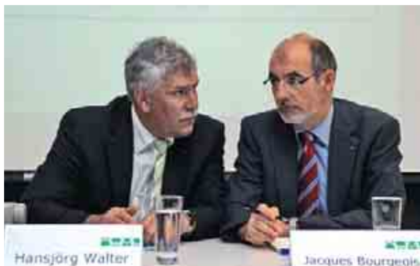
Le président et le directeur en septembre, à l'occasion de la conférence de presse où l'USP a présenté une solution de remplacement à un accord de libre-échange intégral avec l'UE dans le secteur agricole.