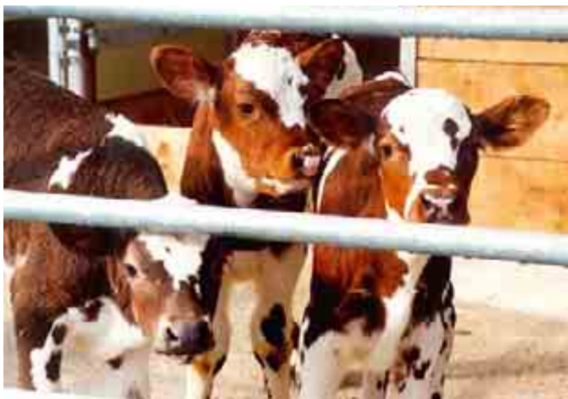
L'USP a réussi à imposer le principe de la protection des investissements lors de la révision du droit de la protection des animaux.

l'USP et Agro-Marketing Suisse (AMS) ont tenu des discussions avec des représentants de la gastronomie. Un projet-pilote a montré la bonne acceptation des produits de marque Suisse Garantie auprès des restaurateurs et des clients. Le projet sera étendu en 2009.