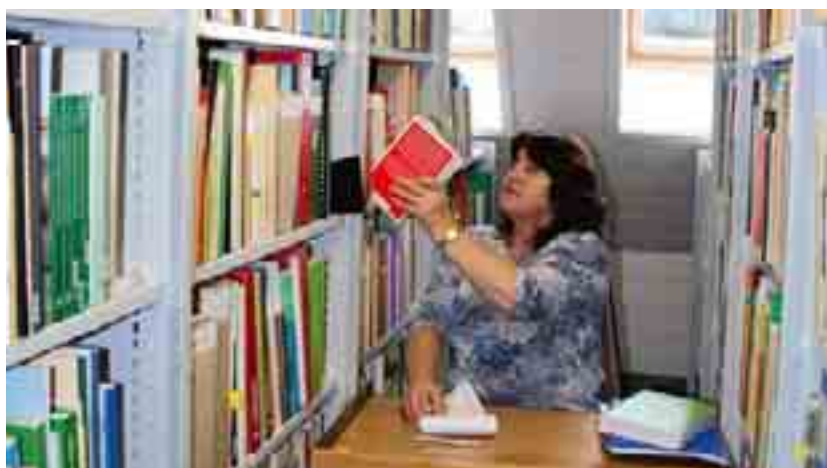
Des milliers de publications sont cataloguées dans les nouvelles salles de la bibliothèque de l'USP.

Outre l'organisation et la gestion d'une cinquantaine de séances des organes de l'USP ou de réunions internes, ainsi que l'établissement des procès-verbaux y afférents, l'administration de l'Union a notamment préparé les élections de renouvellement intégral qui se sont déroulées à l'assemblée des délégués. Les essais et les préparatifs en vue de l'introduction du système d'archivage et de documentation électronique à l'échelle de l'Union ont constitué une autre tâche importante pour cette division. A partir de 2009, ce système permettra de consulter, sous forme électronique, des documents concernant les affaires courantes de l'Union ou possédant une valeur historique pour l'organisation. L'Intranet de l'USP est fonctionnel depuis l'automne 2008: il permet au personnel d'accéder facilement à toutes les informations dont il a besoin. Pour finir, le perfectionnement ciblé de collaborateurs en charge de la création de publications devrait, à terme, se traduire par d'importantes économies.