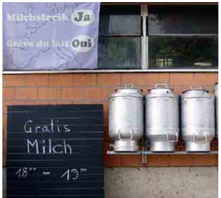
Le 28 mai 2008, de nombreux paysans suisses lancent une grève des livraisons de lait qui débouche sur une augmentation de 6 centimes le litre à partir du 1er juillet.

résultent de prestations agricoles, ainsi que d'activités accessoires accomplies hors de l'agriculture. La hausse des coûts de production a cependant absorbé une grande partie des bons rendements et résultats obtenus. Ce sont surtout les engrais et les carburants qui ont pesé lourd sur les dépenses. En léger recul par rapport à l'année précédente (-0,5%), le revenu net d'entreprise s'est élevé à 2,831 milliards de francs en 2008.