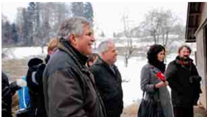
La conférence de presse qui s'est tenue le 6 janvier à Herbligen BE a connu une forte affluence.

Au cours du premier trimestre de cette année, l'USP a pris position sur 12 projets mis en consultation, notamment sur le projet de prorogation de trois ans du moratoire sur l'utilisation des organismes génétiquement modifiés.