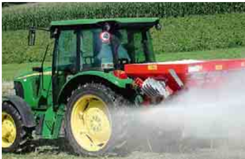
Les prix des agents de productions comme l'engrais ont explosé en 2008.