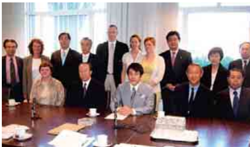
L'USP et des organisations agricoles du monde entier se sont engagées pour défendre les intérêts de l'agriculture à l'OMC.

Les derniers ajustements de la Politique agricole 2011 (PA 2011) ont été arrêtés au milieu de l'année 2008, avec l'approbation du second train d'ordonnances y afférentes. La conversion de plus de la moitié des moyens de soutien au marché en paiements directs d'une part et, d'autre part, la suppression des aides à l'exportation constituaient les éléments-clés de la PA 2011. De nouveaux programmes incitatifs visant à améliorer l'efficacité des ressources ont été lancés dans le domaine de l'écologie. L'USP a coordonné l'adaptation de l'ordonnance sur les paiements directs, et c'est aussi elle qui a présenté la plupart des adaptations requises.