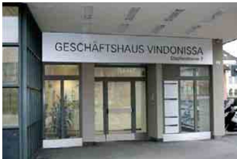
Entièrement rénové sous la direction de l'OCA de Brugg, l'immeuble commercial «Vindonissa» abrite désormais aussi les bureaux de Fiduciaire et Estimations. L'immeuble appartient à la caisse-maladie Agrisano.

des logements et les 11 millions de francs restants des constructions industrielles, artisanales et autres. Comme l'OCA est réparti sur sept sites, il est possible d'entretenir des liens étroits avec les différents maîtres d'ouvrage. Le cadre juridique est en passe de devenir un défi majeur. Il s'avère de plus en plus difficile d'obtenir des autorisations de construire en temps voulu, et sans que cela nécessite un travail qui dépasse les limites du raisonnable. Souvent, plus de temps s'écoule entre l'idée initiale et l'autorisation de construire que pour la réalisation proprement dite. C'est pourquoi l'OCA effectue toujours une analyse interne détaillée au préalable, afin d'obtenir une autorisation de construire sans plus attendre. Par sa proximité avec la défense d'intérêts et les décideurs politiques, l'OCA est en mesure d'anticiper les changements et de s'y conformer avec une longueur d'avance. En 2008, l'OCA a avancé dans la conception d'une nouvelle image sur le marché et renouvelé son marketing. Celui-ci comprend des brochures et de nouvelles annonces.